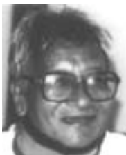
Le journaliste birman Win Tin, condamné à 20 ans de prison

L'album de photographies Jean-Philippe Charbonnier pour la liberté de la presse en vente partout à partir du 17 novembre prochain, présente les portraits de 15 journalistes actuellement emprisonnés.