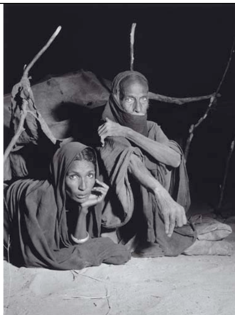
Les Touareg – Sud Saharien, 1951